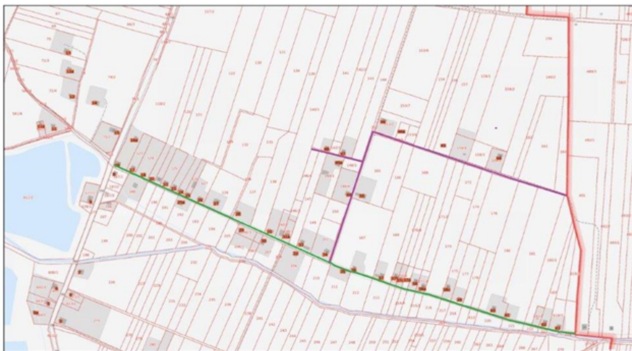
Załącznik nr 1 do Uchwały nr 326/XLV/2022 Rady Gminy Kroczyce z dnia 28 października 2022r.